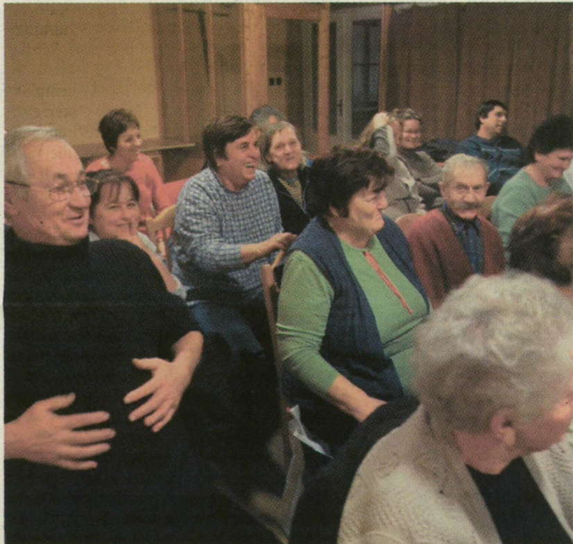
OLVASÓINKAT ÉRDEKELTÉK A LAPKÉSZÍTÉS MŰHELYTITKAI

az új nyomdagép, amely minden oldalt színesen nyomtat, és a jelenlegi kettő helyett mindig egy tagból áll majd az újság. A derekegyházi olvasókat érdekelték az újságkészítés műhelytitkai, többek között az is, milyen szempontok szerint készül a sportoldal és a címlap. A találkozó végén az újságban megjelent emlékeztető írásokkal kapcsolatos kérdésekre lehetett válaszolni, ajándékért cserébe.