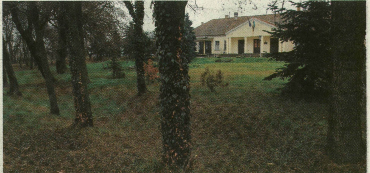
A MŰVELŐDÉSI HÁZAT IS GYÖNYÖRŰ PARK VESZI KÖRÜL DEREKEGYHÁZON