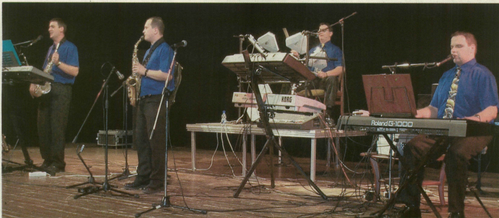
A PARTY EGYÜTTES TAGJAI TÍZ ÉVE MUZSIKÁLNAK EGYÜTT