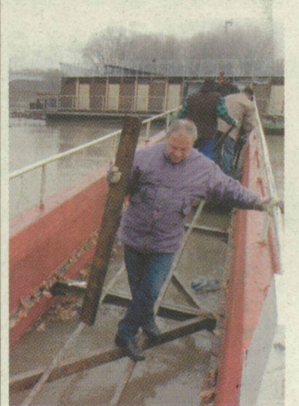
■ ELVONTATTÁK TÉLIRE Fotó: Schmidt Andrea