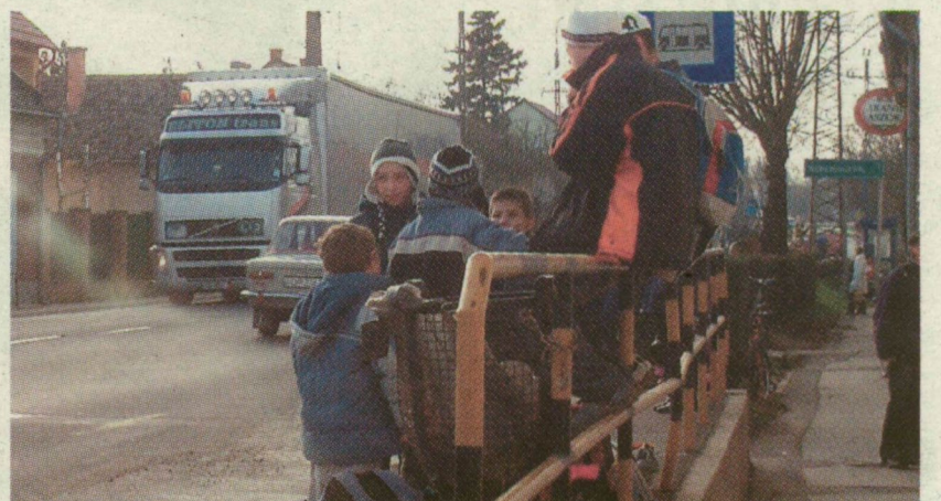
■ A MAKÓI GYEREKEK IS SZENVEDNEK A HIHETETLEN FORGALOMTÓL