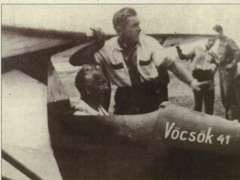
■ PILÓTÁNAK TANULT SZENT-GYÖRGYI ALBERT. A II. VILÁGHÁBORÚ IDEJÉN FONTOLGATTA, HOGY „ÁTREPÜL” A FRONTON

„Szegedi James Bond-ként” – gróf Bethlen István fölkérésére – elvállalta, hogy Isztambulban, tudományos előadás leple alatt titkos tárgyalásokat kezd a szövetségesekkel. Izgalmasnak találta, hogy a megbeszélés végéig nem tudta biztosan: a brit vagy német titkosszolgálatlalt tárgyal. Kémregénybe illő fordulatokkal lett főszereplője a cselszövésnek, kapcsolta össze Kállay miniszterelnököt az angol kormánnyal. Ezt a németek olyannyira komolyan vették, hogy Hitler Horthyt magához hívatta és Szent-Györgyi fejét követelte. A tudós ezt tartotta politikai pályája csúcspontjának. Magyarország német megszállását követően a Gestapo üldözte, apósa Horgos melletti szőlőjében, majd Budapesten bujkált, hosszú haját és szakállt növesztett. Fontolgat-