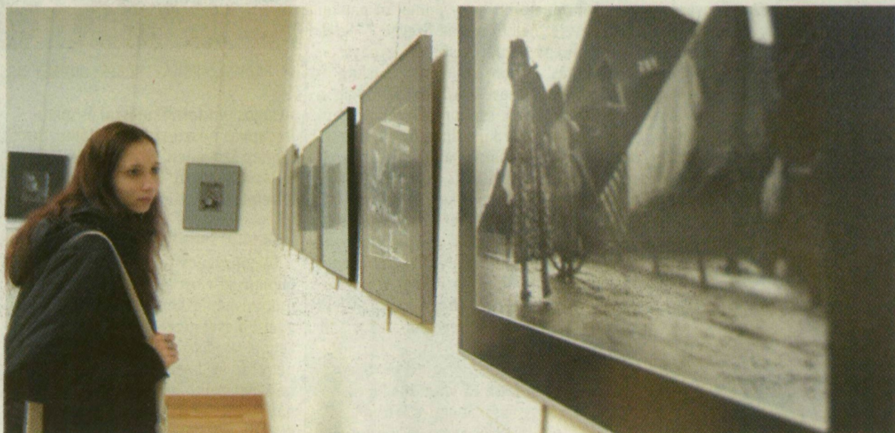
A FEKETE-FEHÉR MŰVÉSZETI FOTÓK MEGDÖBBENTŐ EREJÜEK