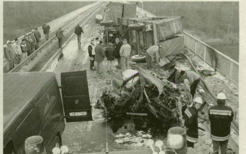
A HÉT ÉVE TÖRTÉNT BALESETBEN HÁRMAN VESZTETTÉK ÉLETÜKET

Az ügyészség szerint a híd mindkét oldalára a „Csúszós úttest” táblát és a