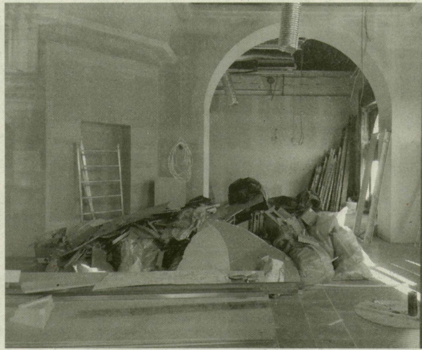
KASZINÓRA „GYÚRNAK” AZ ÉPÍTŐK. A HÍD UTCAI PATINÁS ÉPÜLETBEN HAMAROSAN PROFILT VÁLTHATNAK