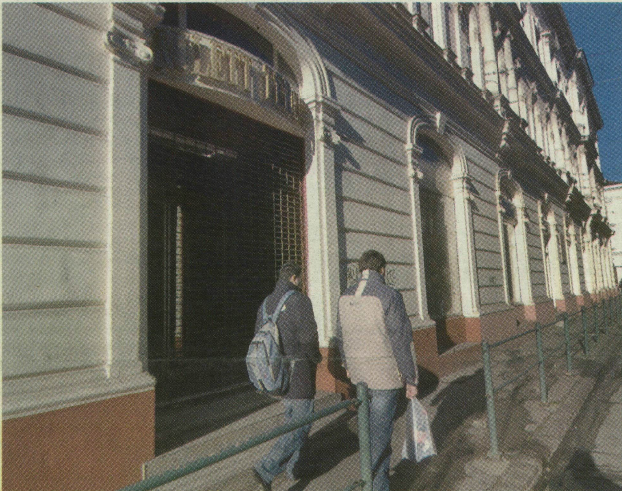
■ RULETT-TEREM. A KELEMEN UTCAI ÉPÜLET „HOMLOKÁN” MÁR MEGJELENT AZ ÚJ CÉGÉR