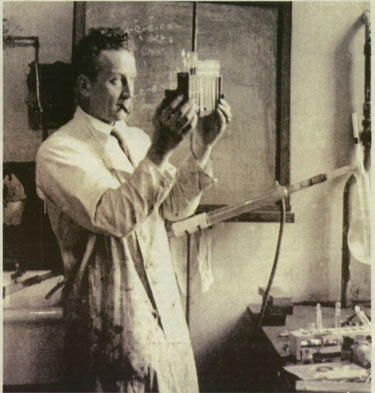
■ SZENT-GYÖRGYI ALBERT MUNKA KÖZBEN – VALÓSZÍNŰLEG CAMBRIDGE-BEN