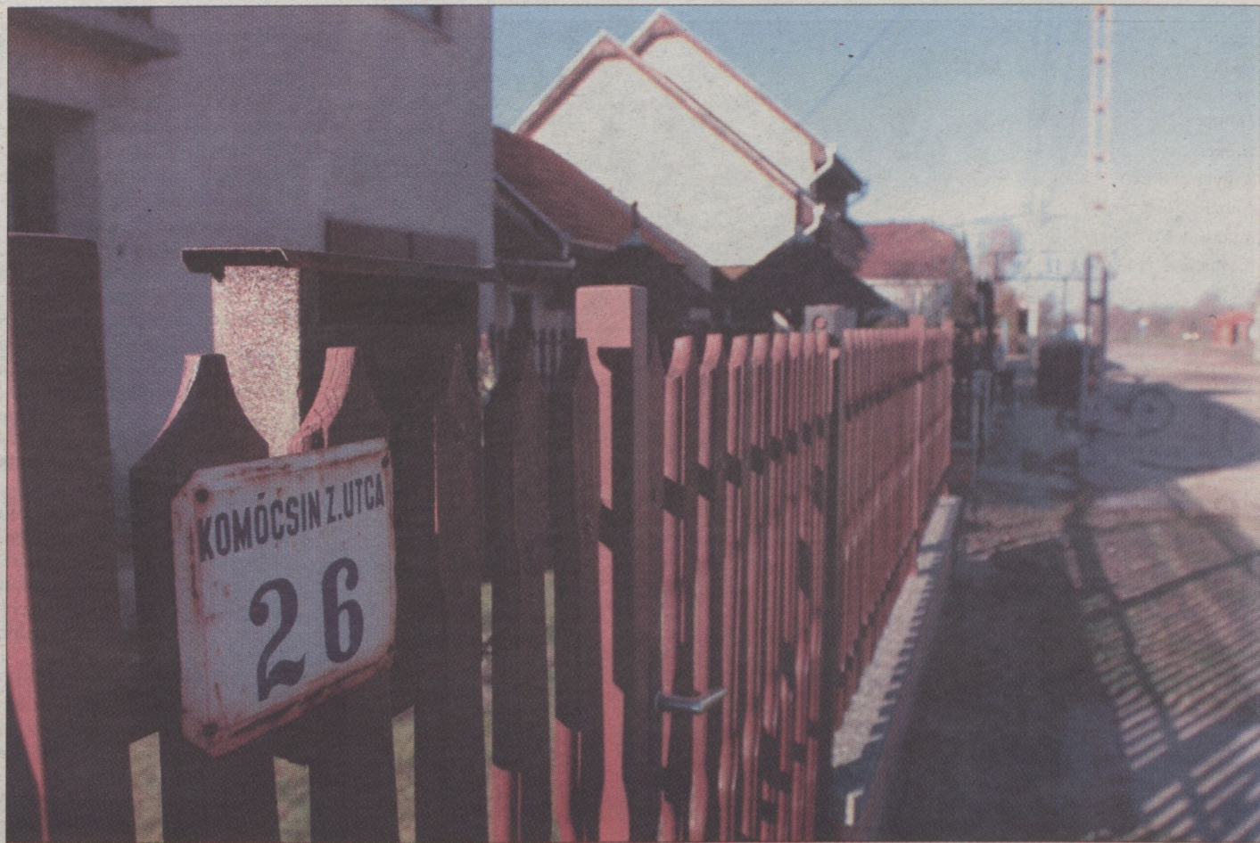
Ópusztaszer, Komócsin Zoltán utca. A múlt rendszer egy szelete