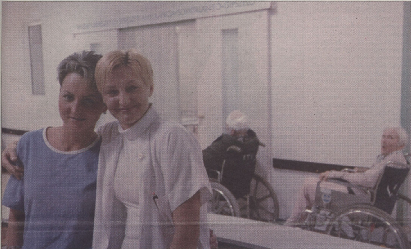
Utolsó csoportkép lapunk kedvéért. Kényszeredett volt a mosoly