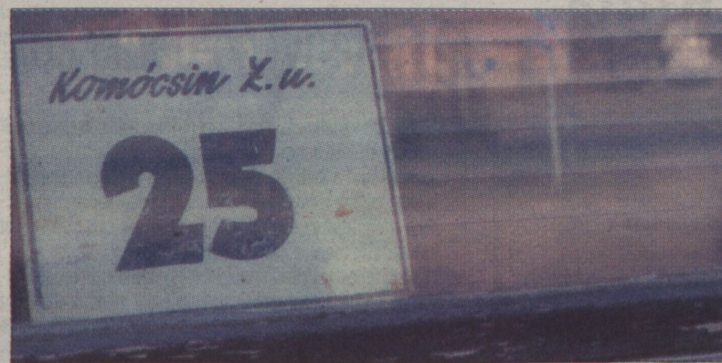
A faluban senkit sem zavar az utcánév