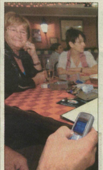
Két szegedi vendéglőben már telefonon is fizetheti számláját a vendég