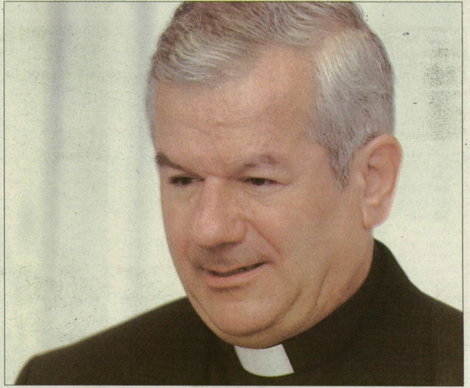
Kiss-Rigó László: Egyesek azt gondolják, hogy az élettársi viszony jó nekik, holott mindez éppen a társadalom önpusztítását jelenti

Jelenleg Magyarországon 270-280 ezer élettársi kapcsolatot tartanak számon. A magyarok több mint 12 százaléka ilyen kapcsolatban él. Csongrád megyei statisztikák szerint a gyerekek csaknem egyegyede házasságon kívül születik. Ez azt jelenti, hogy minden negyedik gyerek vagy élettársi kapcsolatban vagy pedig egyedülálló anyja mellett nő föl. Kissné Novák Eva családszociológus szerint a magyarok inkább házasságpártiak, szemben a svédekkel vagy az észtekkel, ahol a párkapcsolatok fele élettársi viszony.