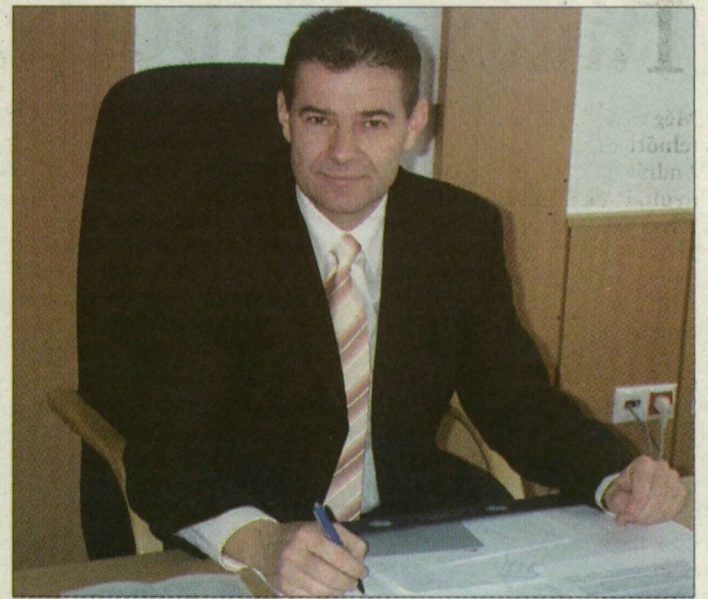
A város új kapitánya eddig a rendőrség belső visszaéléseit derítette fel