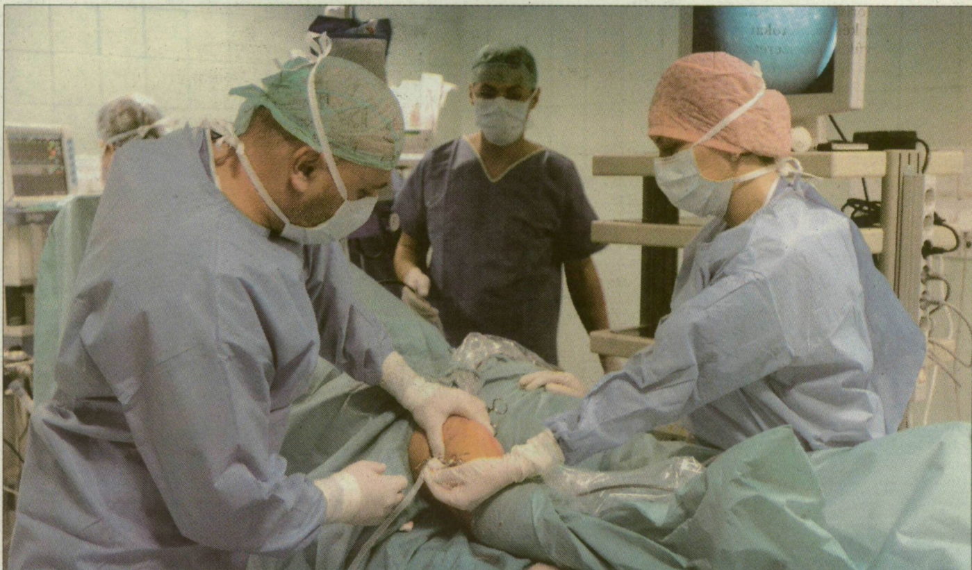
A kisteleki egészségügyi központban évente ezer műtétet végeznek majd

Amint arról már többször is írtunk, a megyében a makói és a vásárhelyi kórház mellett a Kisteleki Egészségügyi Kht. nyert pályázatot az egynapos sebészeti finanszírozására. Az Egészségügyi Minisztérium az ország 103 intézménye közül negyvenhatnak ítélte oda a lehetőséget. Az Országos Egészségbiztosítási Pénztár azért írt ki pályázatot erre az ellátási formára, hogy a kórházi bennfelevesztést nem igénylő beavatkozásokat ambulánsan végezzék az intézmények. Míg ugyanis 2004-ben Angliában a sebészeti műtétek 53, Dániában 52, Hollandiában pedig 48 százalékát vé-