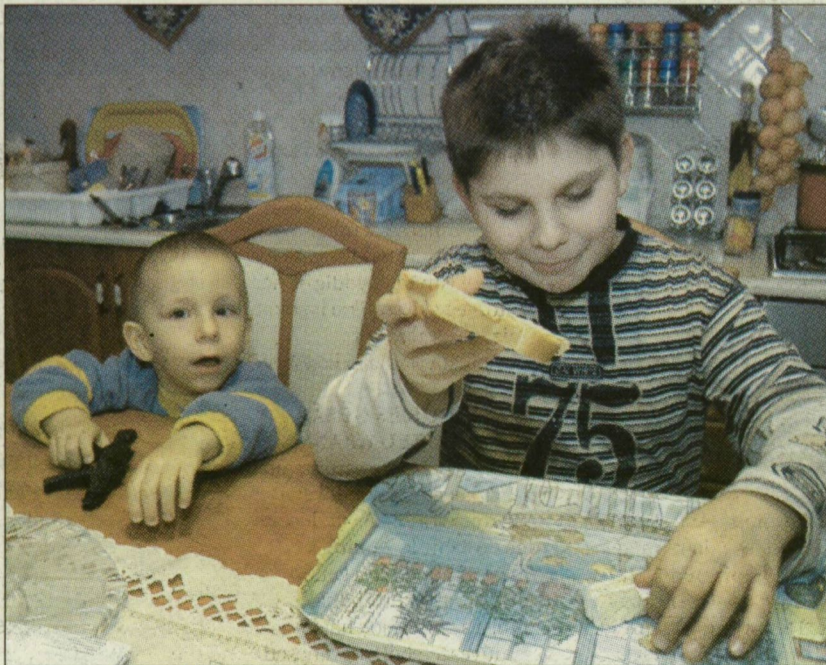
Tegnap este is a nagymama készített vacsorát a gyerekeknek