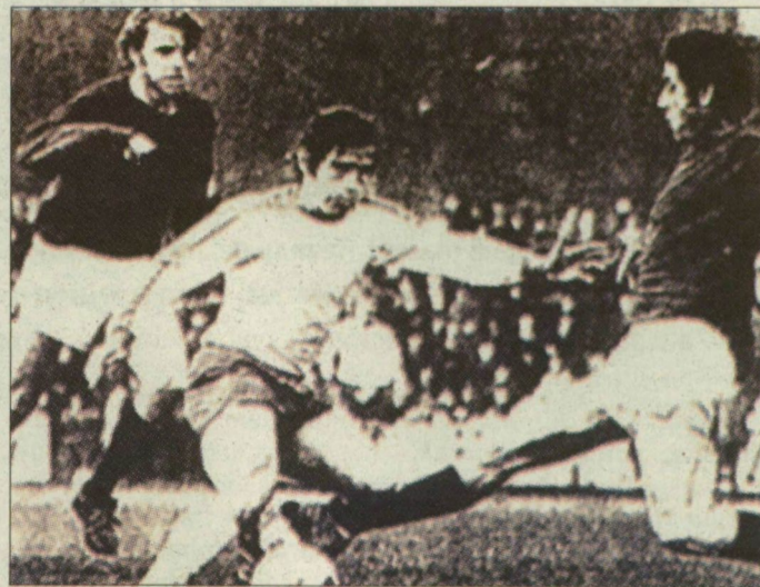
Kocsistól rettegtek a védők