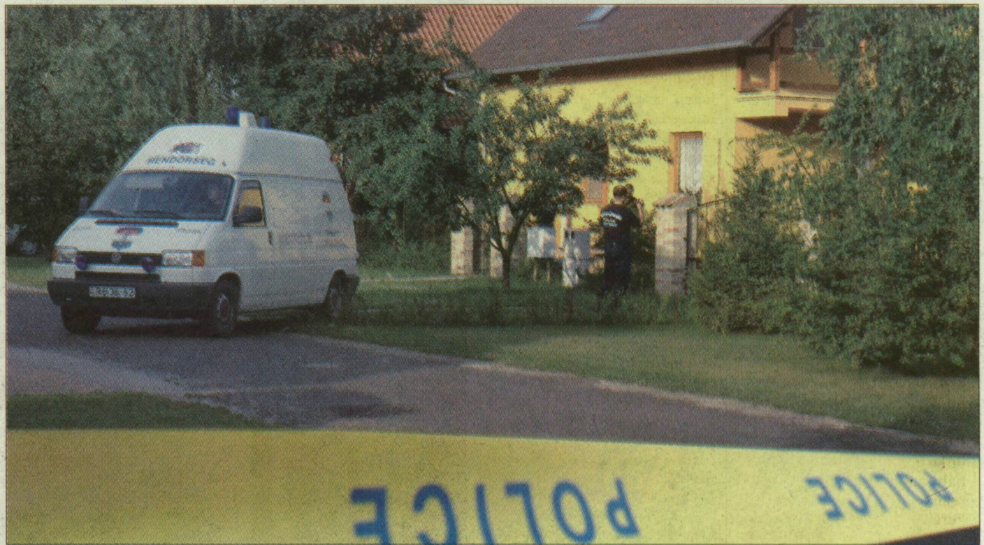
Tavaly nyári fotónk akkor készült, amikor a nyomozók a gyilkosság helyszínén vizsgáloktak