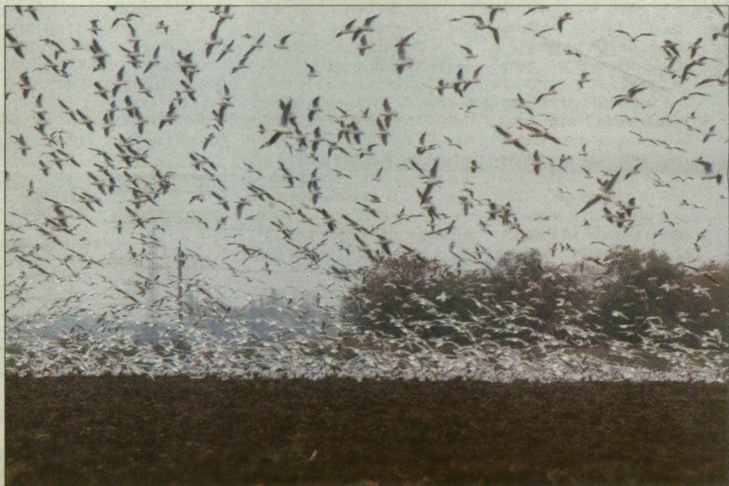
A szántóföld felett kavargó sirályokat kapta lencsevégre fotós kollégánk egy borongós őszi napon

HALAK (II. 21–III. 20.): A rekreáció, a felfrissülésnek kedvez a mai nap. Ha teheti, vegyen ki pár nap szabadságot, kedves Halak! Otthonában, ha lehet, selejtezzon!