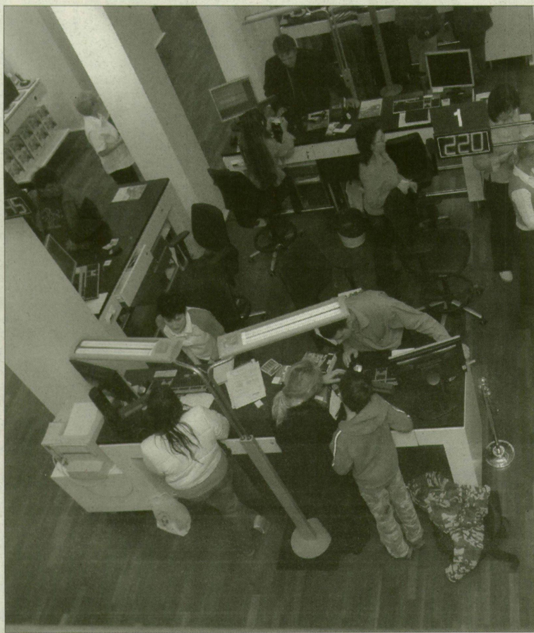
A műholdról érkező zene megkönnyíti a várakozást