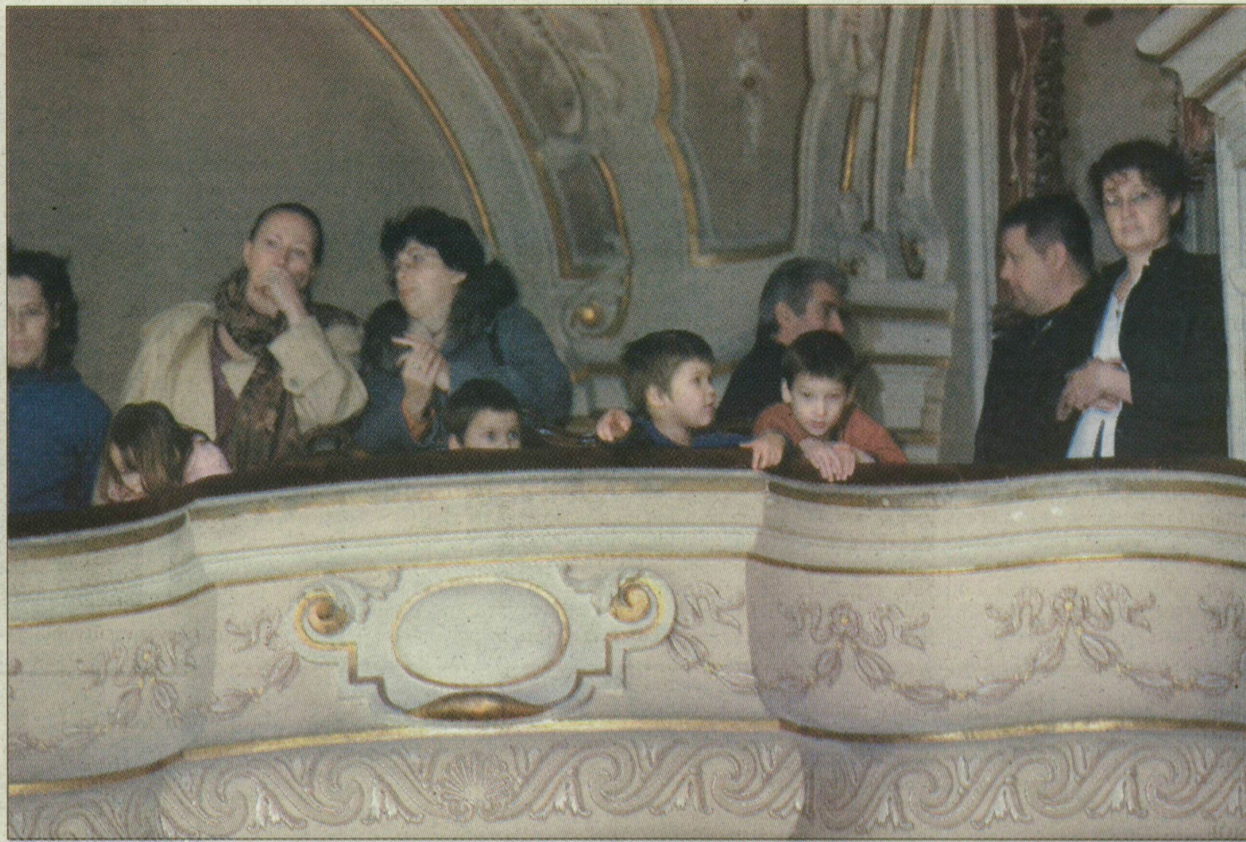
A Deák utcai ovisok és a szüleik a karzatról szorítottak azért, hogy ne zárják be az intézményt