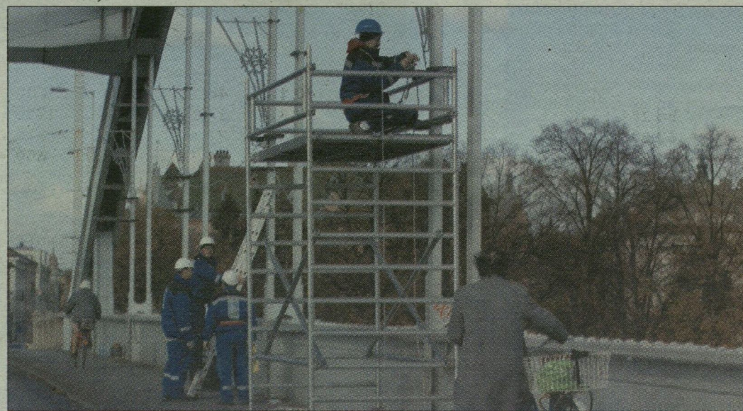
A díszkivilágítást decemberben kapcsolják be