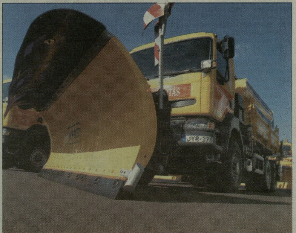
Hóeltakarítók sorakozója