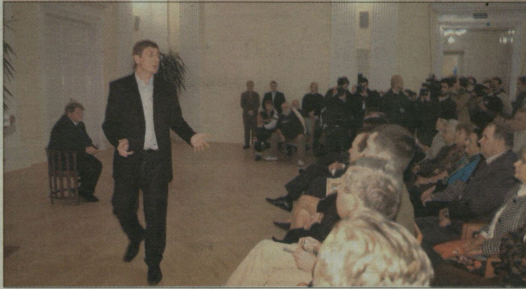
Gyurcsány Ferenc a megyeháza nagyertermében

A kormányfő szerint azonban a jobb világot nem méterekben és kilogrammokban mérik. – Nem gondolom, hogy a sikert olcsón fogják adni – állította. Annál is inkább, mivel az elmúlt másfél év teli volt küzdelmekkel. Sokan kérdezik tőle, hogy nem lehetne-e lassabban „csinálni”. De Gyurcsány azt vallja: ha változtatni kell, azt jobb megtenni viszonylag gyorsan. Az előző kormányzati ciklust úgy értékelte, hogy tele volt sikerrel és hihetetlenül sok konfliktussal. Mint említette: Szirbikkal átnézték a szentesi eredményeket. A beruházások hallatán azt mondta a miniszterelnök a polgármesternek, hogy „Imre, ez nem lehet az utóbbi 1-2 év” termése, mert