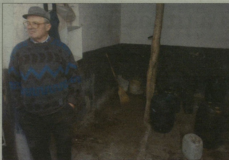
Közel tízezer liter gázolajat foglaltak le a tanyán