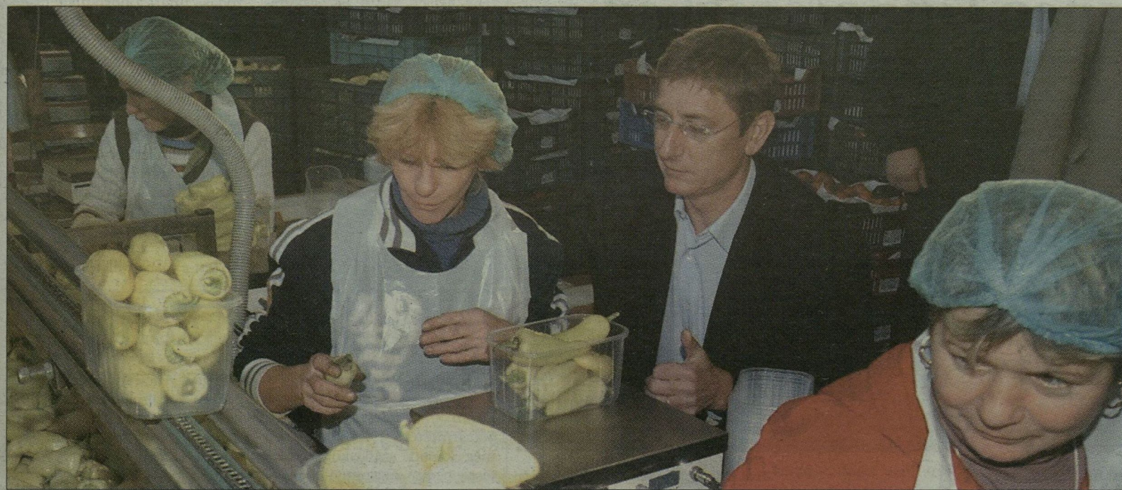
Az Árpád-Agrár Zrt. üvegházának csomagolójában Gyurcsány Ferenc leült a szalag mellé