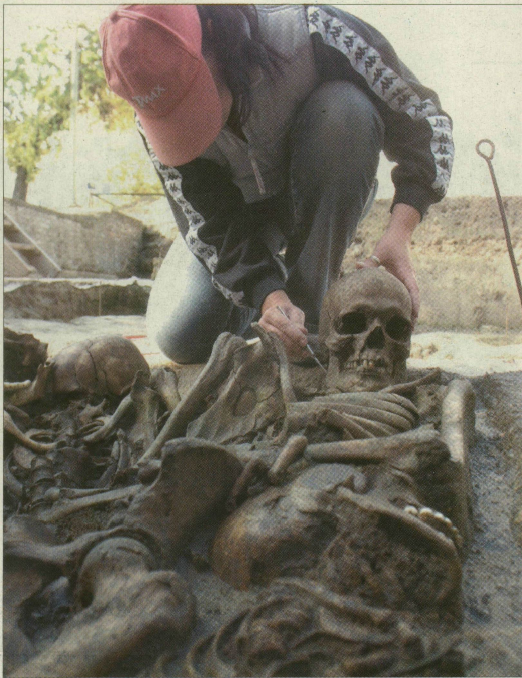
A csontokat régészek tárják fel, majd antropológusok vizsgálják meg