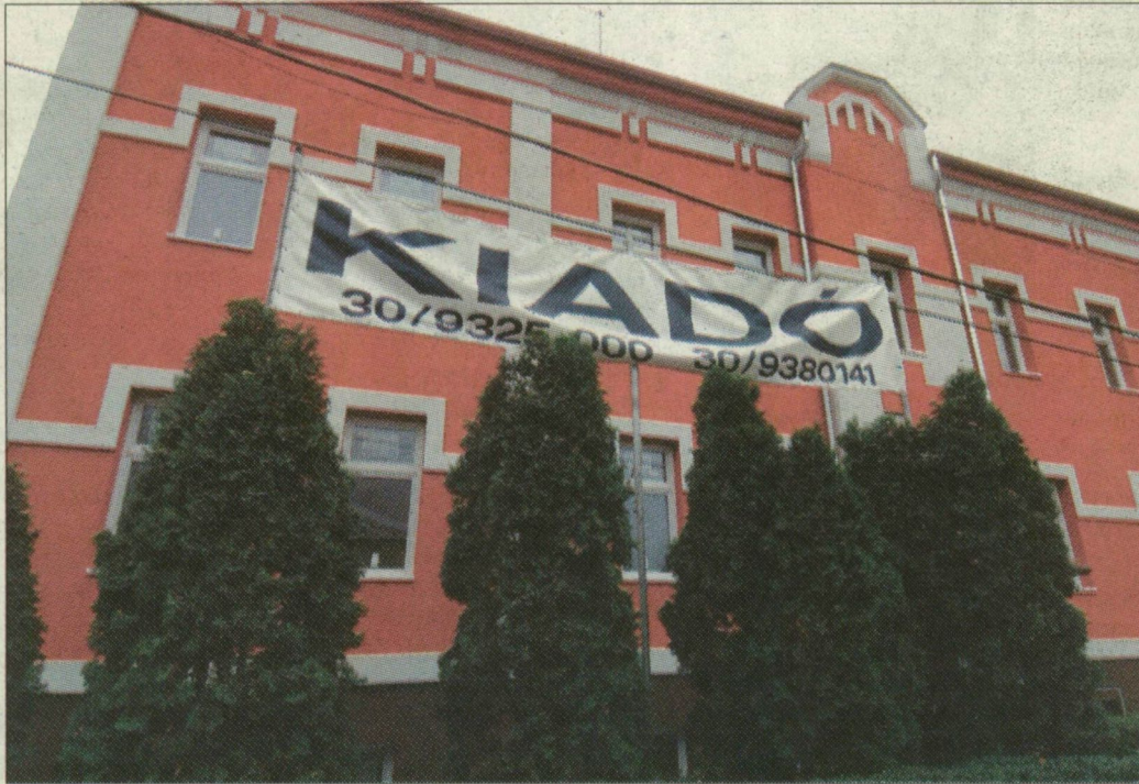
A Pulz utcai volt fertőzőt már eladta a város, úgy tudjuk, a pénzt az egyetem kapja