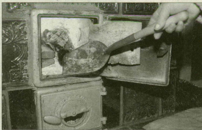
A hagyományos széntüzelés kiszorulóban van