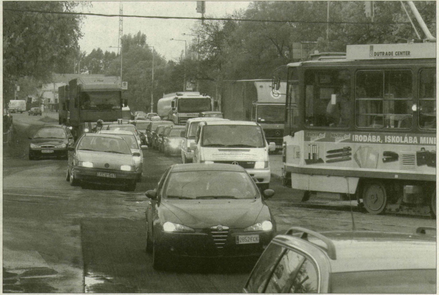
Autó autó és villamos hátán a Rókusi körút és a Kossuth Lajos sugárút találkozásánál