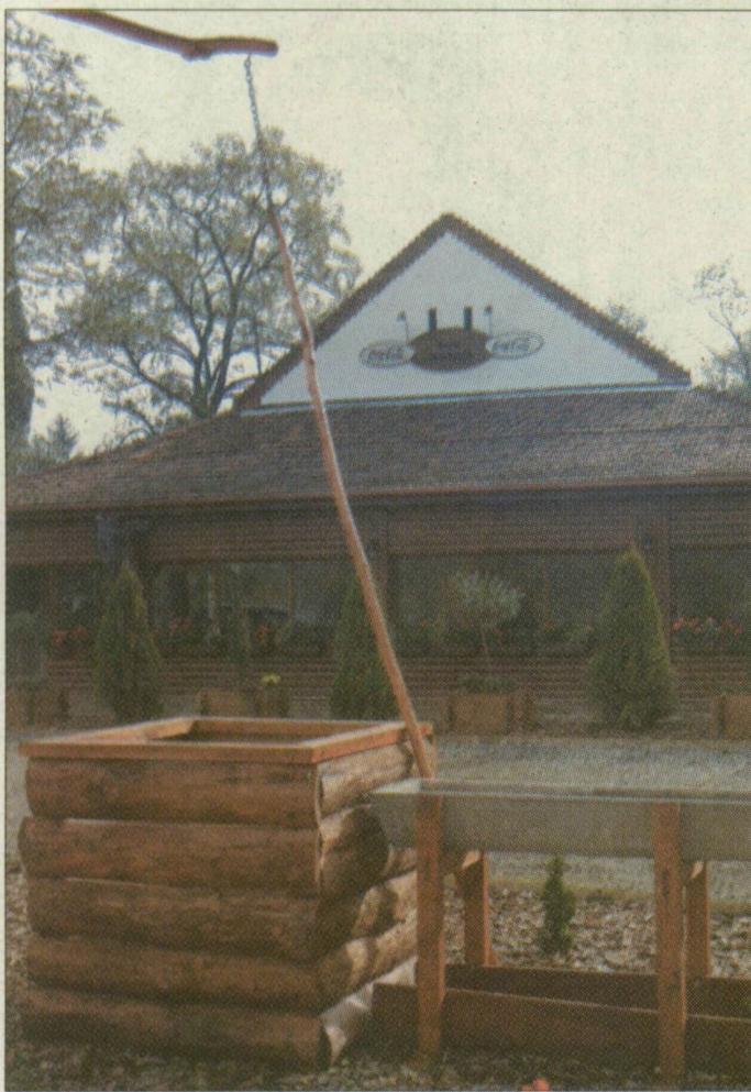
Díszgémeskút is emelkedik a felújított vendéglő előtt