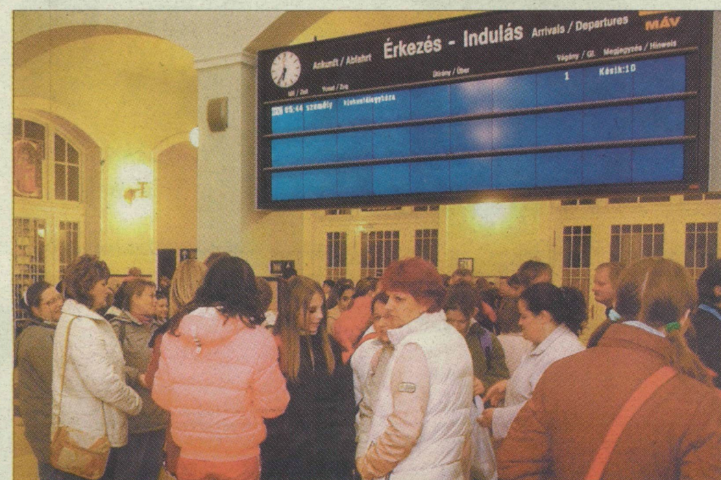
Reggeli csúcs a szegedi nagyállomás várótermében. Nincs mivel elutazni