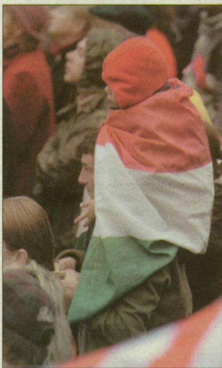
Apa és fia a nagygyűlésen.

Egy lány hamis hangon elénekli a Himnusz – ezzel kezdődik a Fidesz-rendezvény délután 3 órakor. A szervezők szerint negyedmillióan vagyunk. Felkérjük a résztvevőket, hogy aki agresszív magatartást tanúsít, nem békés szándékú embert lát, szóljon nekik, ők pedig kiemelik azt a tömegből. Előbb Wittner Mária országgyűlési képviselő beszél, szerinte az 56-os forradalom 50. évfordulóját gyálázatos módon vérbe fojtották. 2008-at a megtorlás évének nyilvánítja. A miniszterelnök nevét nem mondja ki, csak monogramot használ. A pfujozáshoz ez is elég. Tarlós Ist-