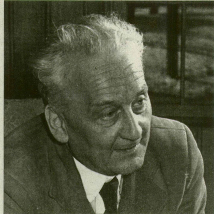
Szent-Györgyi Albert közbenjárására a The New York Times és a Nature magazin is közölte a szegedi egyetemi tanárok felhívását