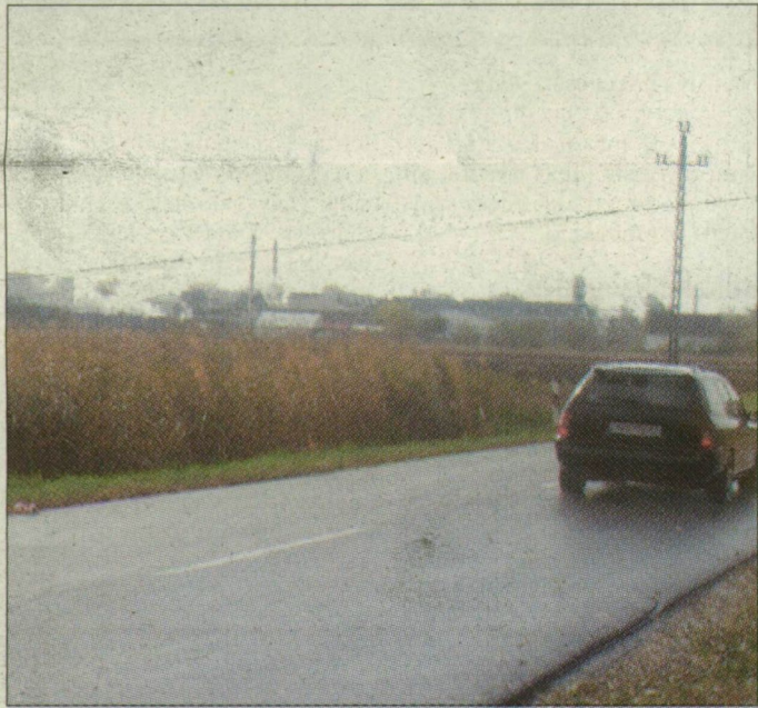
A Makótól északra eső, zombékos terület ideális élőhely a vörös hasú unkák számára