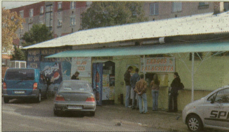
A gettóbüféként elhíresült lepusztult barakk Tarján szégyene