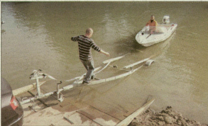
Utolsó méterek a Tiszán. A hajótest ráúszik a vontatószerkezetre