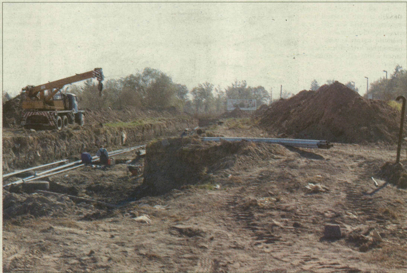
Tereprendezés. Kábeleket helyeznek át, hogy az üzletek építése megkezdődhessen