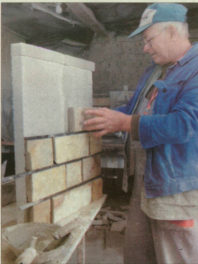
Készülnek a kandallóelemek. A laikus számára hihetetlen, hogy e legókból épül majd meg a mű