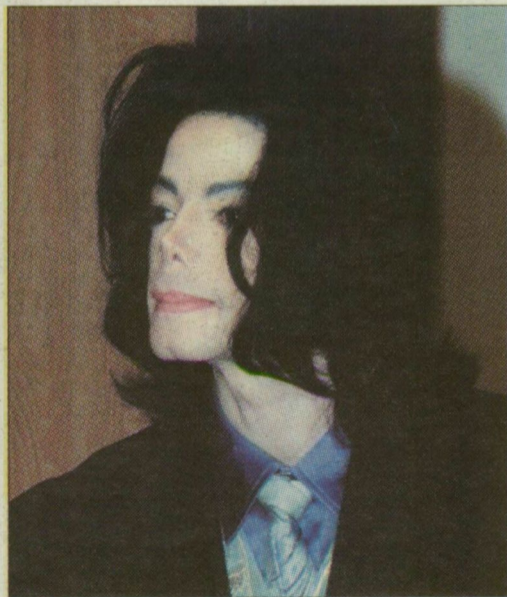
Jackson a két évvel ezelőtti tárgyaláson

Michael Jacksonnak az elmaradt honoráriumok mellett azt a 175 ezer dolláros (mintegy 31 millió forint) költséget is ki kell fizetnie a két évvel ezelőtti perében őt képviselő jogi irodának, amelyet a cég költött ügyvédre a sztár rendezetlen tartozása miatt indított perben – ezt a döntést hozta egy Los Angeles-i fellebbviteli bíróság. Az ügyvédi iroda tavaly februárban perelte be az énekest, mivel nem kapta meg a szolgáltatásaiért járó összeget. Az iroda egyébként 2005-ben képviselte a sztárt, aki gyermekzaklatási ügyben ült a vádlottak padjára.