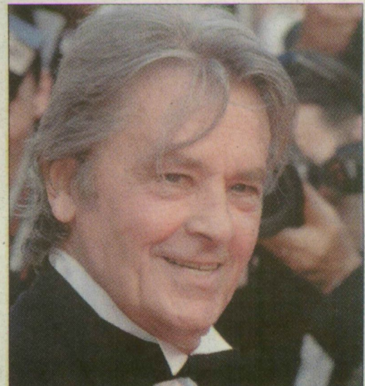
Delon nem vett részt az aukción

Közel 9 millió euróért (mintegy 2 milliárd 250 millió forint) kelt el hétfőn este Párizsban Alain Delon festménygyűjteményének egy része a Drouot cég árverésén. Az 1950-es évekből származó mintegy 40 darabos kollekciónak a legmagasabb áron a kanadai Jean-Paul Riopelle A madár völgye című képe kelt el: 220 millió 685 ezer forintnak megfelelő eurót fizetett érte az új tulajdonos. A zsűfólásig megtelt párizsi terembe a világ minden tájáról érkeztek vevők, illetve azok képviselői. Maga Delon nem volt jelen, asszisztense tájékoztatta folyamatosan a fejleményekről a Douchyban lévő birtokán tartózkodó színészt.