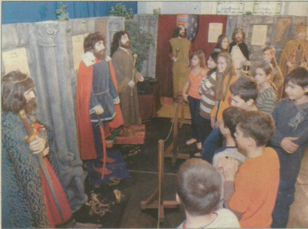
Uralkodók díszletfalak között. A háttérben korabeli zene szól