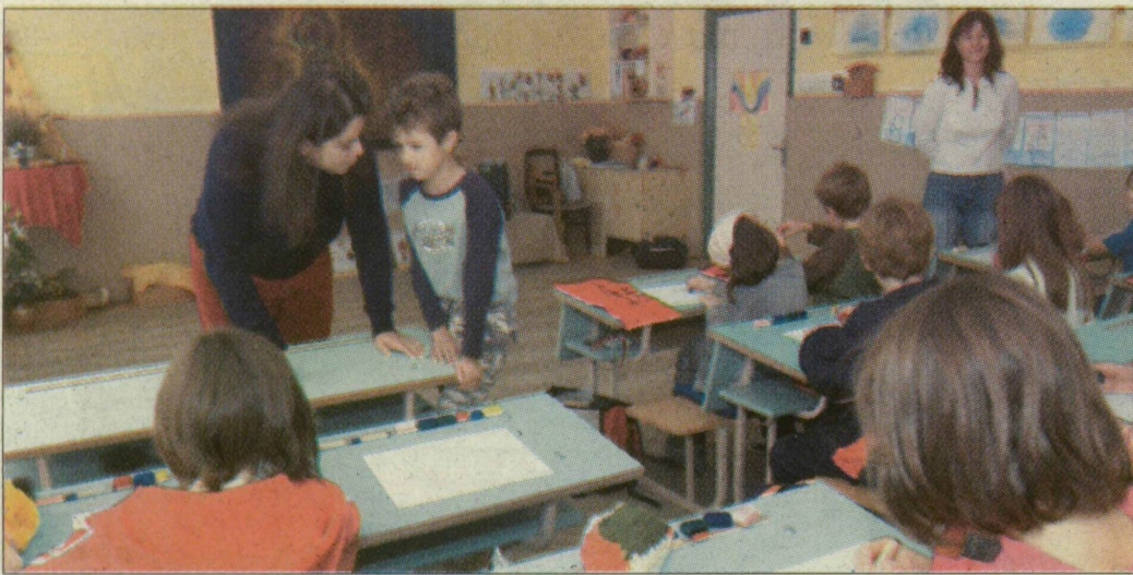
Jövőre gimnáziumi osztályt is indít az iskola

Szeptembertől új helyen, a Kolozsvári téren, az egykori Móra-iskola helyén működik a szegedi Waldorf-iskola. A legidősebb diákok most nyolcadikosok, ezért az intézmény 2008 ősztől gimnáziumi osztályt is indít.