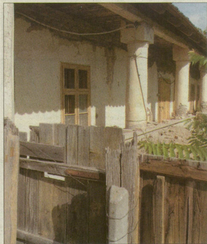
A munka első fázisát novemberben követi a folytatás