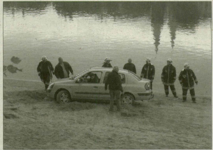
Az autó megmenekült