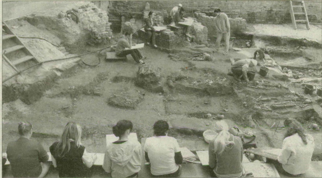
A régészeti „élő kiállítást” több mint háromezren keresték fel