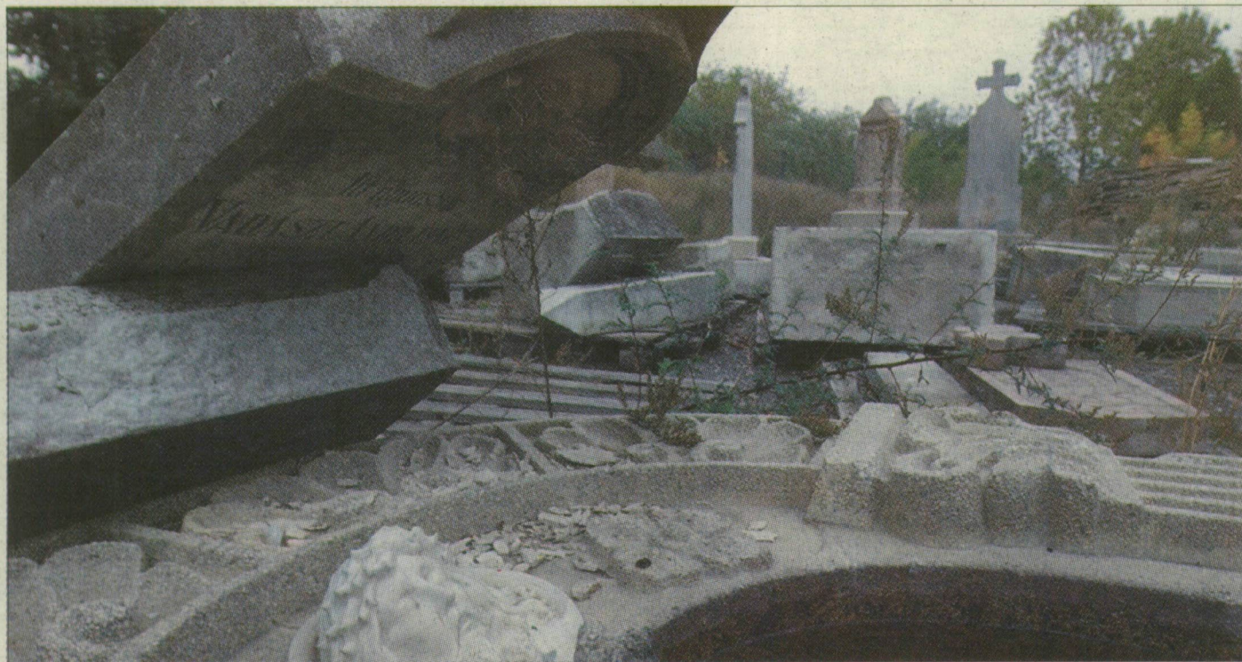
Három éve a Belvárosi temetőben tárolják a Gyevi temetőből származó sírköveket