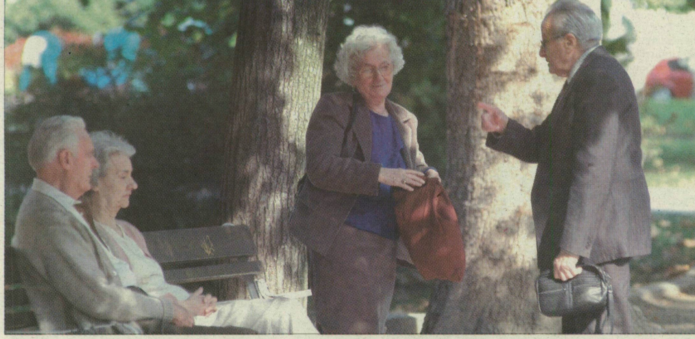
Őszi napsütésben. A megye népességének 22 százaléka, mintegy 93 ezer ember hatvanéves vagy ennél idősebb