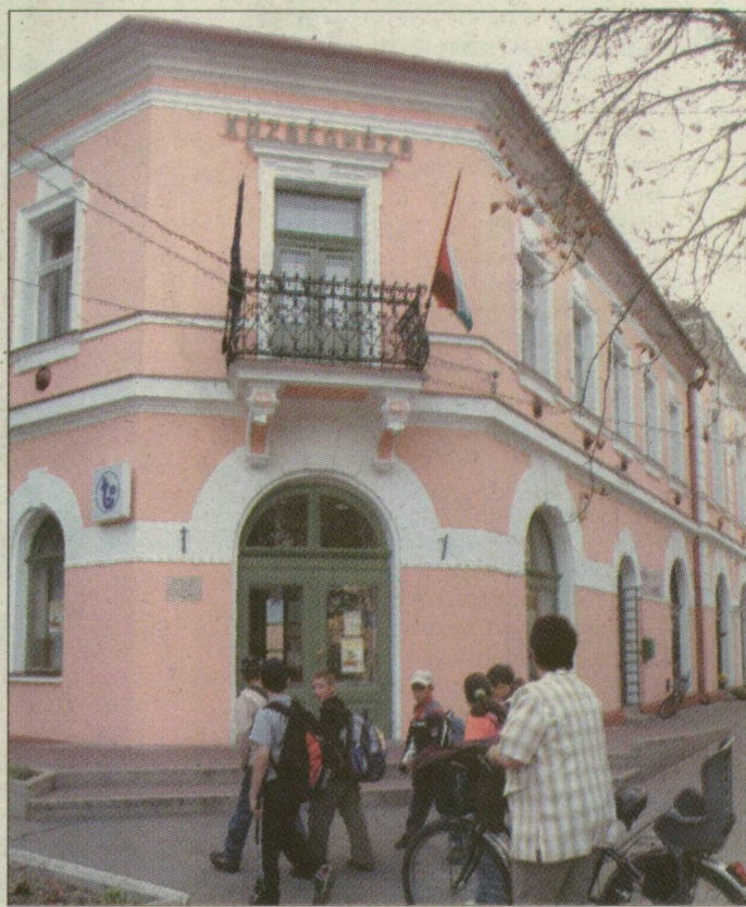
A községháza még a 19. században épült, idén pedig megújult

Ami a falu jelenét illeti, a gondok hasonlóak, mint a környező településeken. A rendszerváltás idején sokan kiszorultak a mezőgazdaságból, megszűnt több termelő vállalkozás, ma lényegében csak szolgáltató, vendéglátással és kereskedelemmel foglalkozó cégek működnek Csanádpalotán. A legnagyobb munkaadó az önkormányzat, a munkanélküliség nyolc százalék körüli. A falu anyagi helyzete sem különbözik sokban a kistérségben lévő többitől: az éves költségvetés hatszázmilliós, tavaly tizenötmilliósi hitellel zárták az évet. Idén sem lesz lényegesen könnyebb, bár az önkormányzat komoly ésszerűsítésbe fogott.