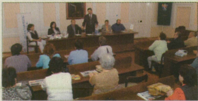
Olvasóink többnyire elégedettek lapunkkal