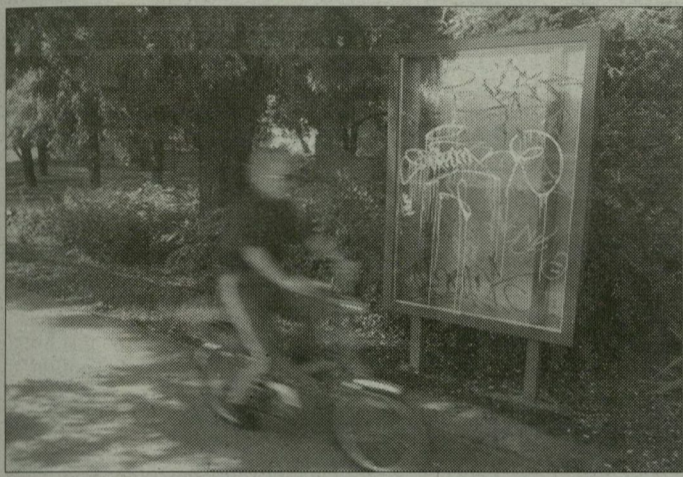
Mára csak a hült helye látszik a színes térképnek a szegedi Stefánian