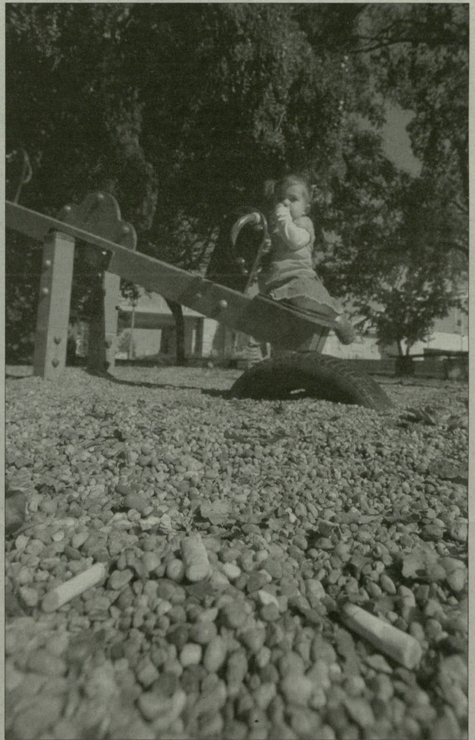
A szegedi játszótéren gyakori látvány az eldobott csikk

FELÜGYELŐ ÚR, VIGYÁZ A GYEREKRE? – Persze, jó ötlet, hogy ne füstöljünk a gyerek körül. Csak hogy ha dohányzó létemre lehozom a két lányomat a játszótérre, akkor félóránként hagyjam őket magukra, amíg elszívok egy cigit? Vagy addig a közterület-felügyelők vigyáznak rájuk? – kérdezett vissza egy anyuka a Stefánian.