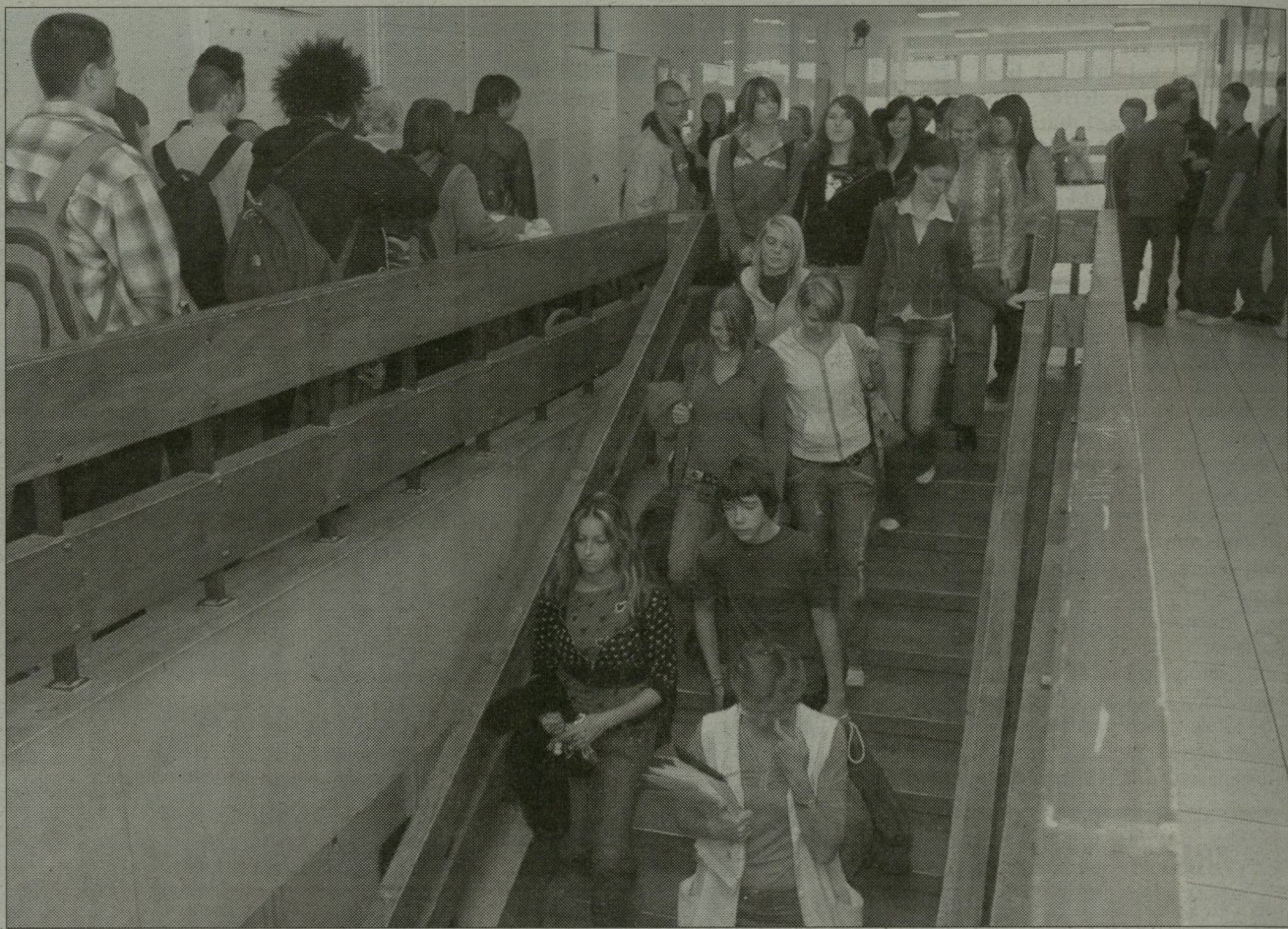
Eötvös József Gimnáziumként szerepel Szeged város honlapján, pedig az SZKTT Közoktatási Intézmény Eötvös József Egységes Iskola a hivatalos neve – a „mamutiskola” központja is itt található