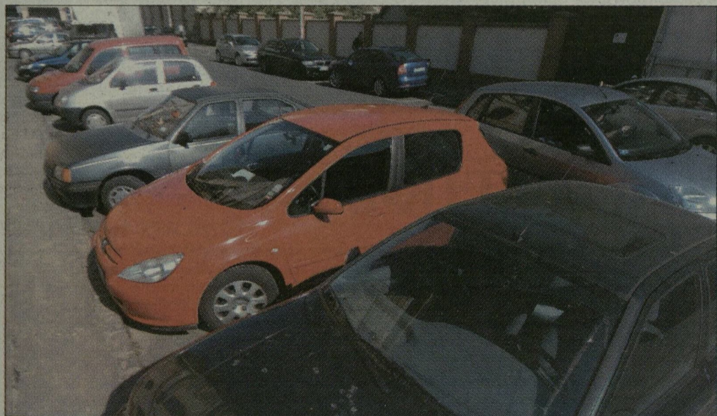
A Toldi utcai parkoló mindig tömve van