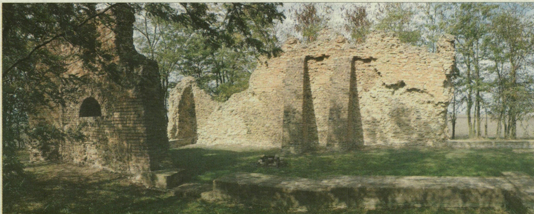
Vásárhely középpontjától 17 kilométerre keletre még ma is áll Csomorkány mezőváros gótikus téglatemplomának romja. Az óriásfalu 1596-ban a tatárjárás következtében pusztult el