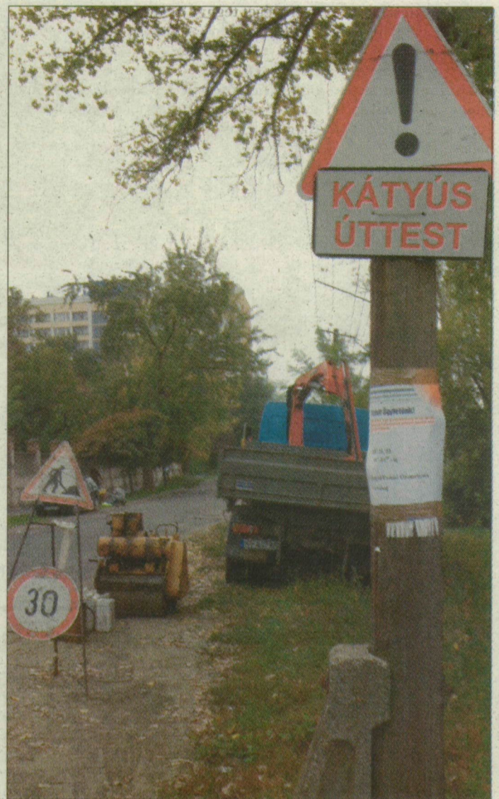
Várva várt fordulat: többévi vita után javítják az Acél utca burkolatát