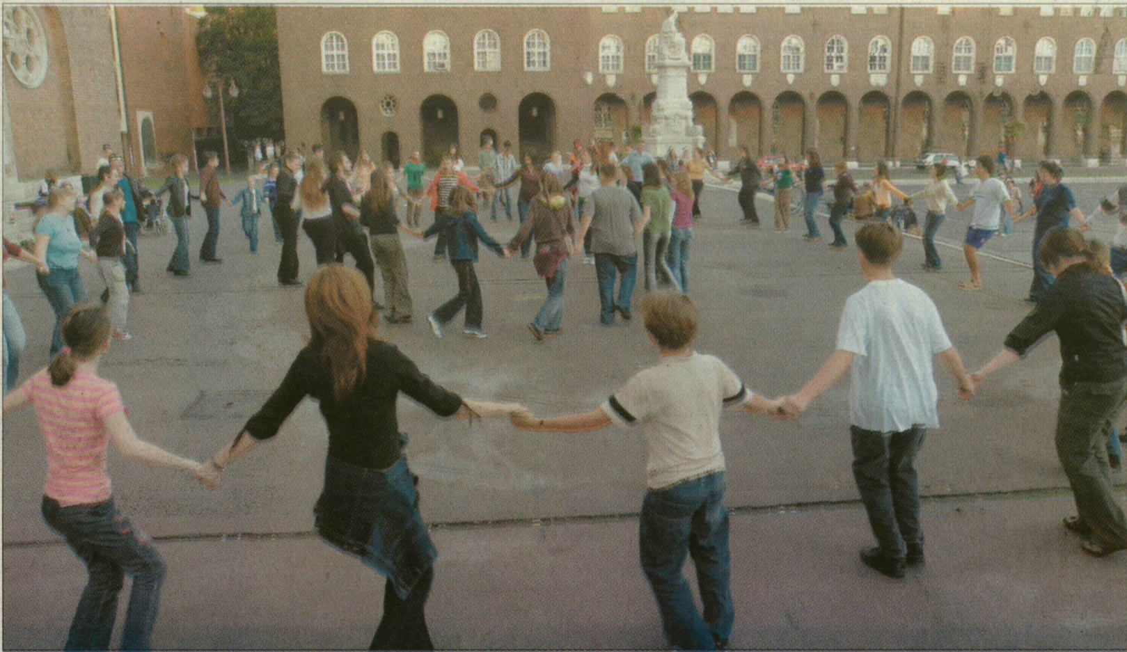
Keresztény fiatalok körtánca a dóm tornyainak árnyékában