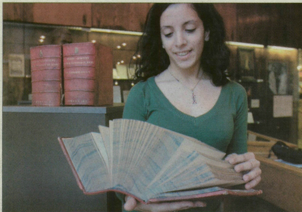
A „könyvkocka” gerince nagyobb, mint a lapjai