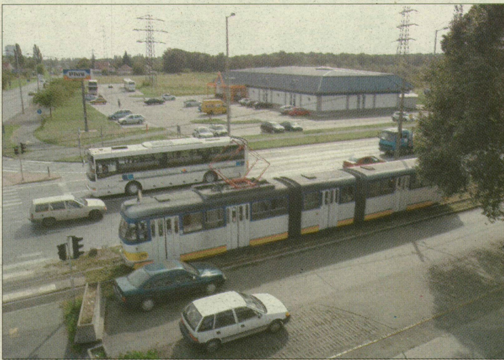
A Plus Áruház mögötti területen épül majd az új buszpályaudvar

Mint emlékeztet, a legutolsó elgondolásban a Bakay Nándor és a Vásárhelyi Pál utca sarkán, az autóbusz-társaság saját telkén létesült volna a pályaudvar, bevásárlóközponttal kiegészülve. A Tisza Volán Zrt. a nagyszabású elképzelésekhez befektetőket keresett és talált is. A tervek azért hiúsultak meg, mert hárommil-