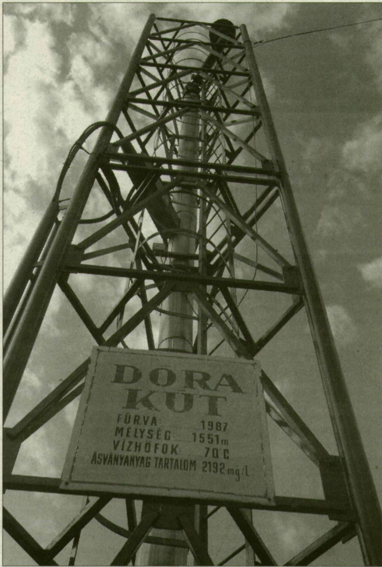
Más ár folyik az ellenzéknek és más a „kormányoldalnak”. A Dóra termál- és gyógyvízkút adja a legnagyobb vízhozamot

Az alpolgármester szerint a Hunguest Hotels sohasem kérte a hét kút tulajdonjogát. Nem vagyok műszaki