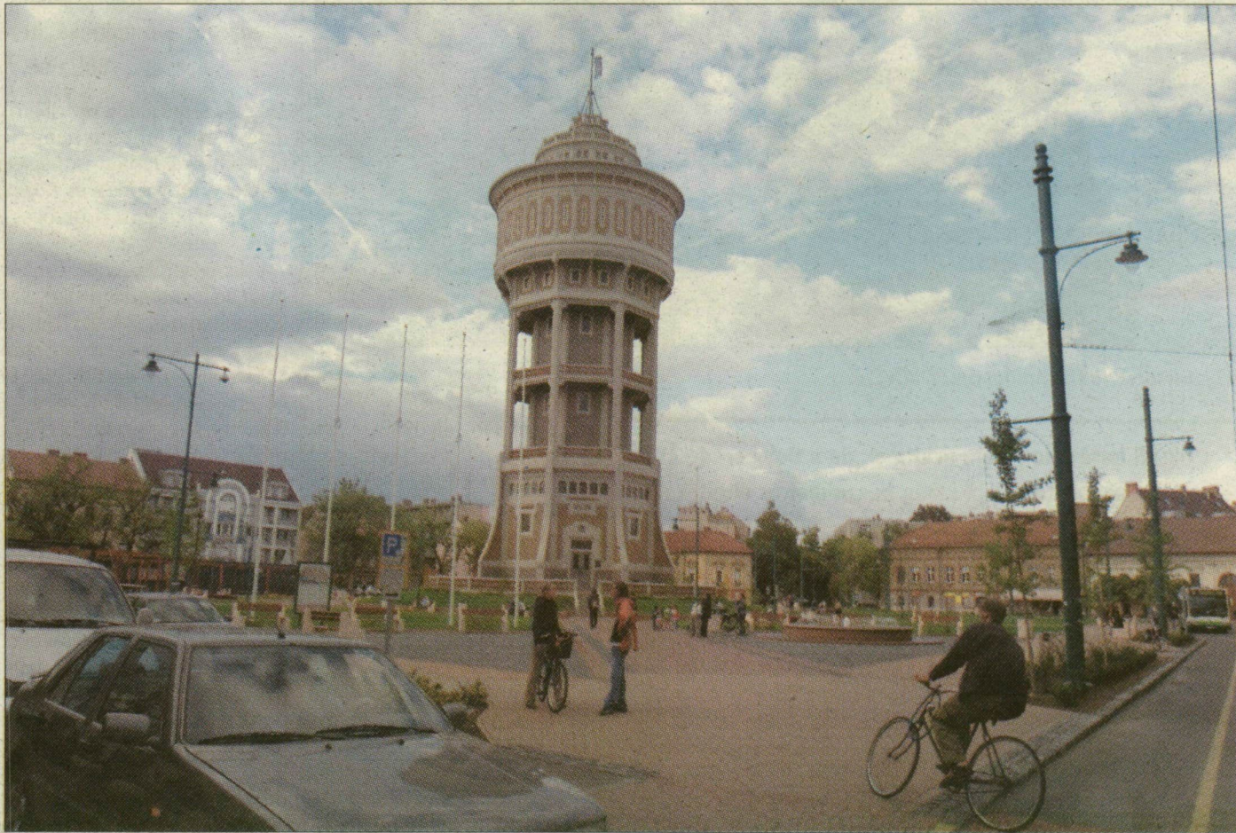
A város mozgalmas, de egyik legrendezettebb szeglete lett a Szent István tér

– Éppen ez a mi bánatunk: nagyon várjuk, hogy megszépüljön a mi házunk is, ha már egyszer a tér ilyen csodálatos lett, s elkezdődött végre a sarki palota felújítása is. De úgy tudom, készülnek az engedélyezési tervek, s talán nemsokára a mi házunk miatt sem kell a térnek szégyenkeznie – magyarázta az unokáját sétáltató férfi. Aki-ről gyorsan kiderült, nem csupán nézi, de látja is a teret. Méghozzá elég kritiku-