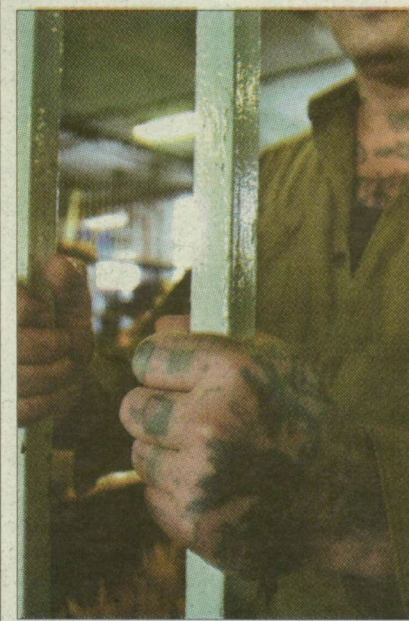
Kilátások a Csillagból