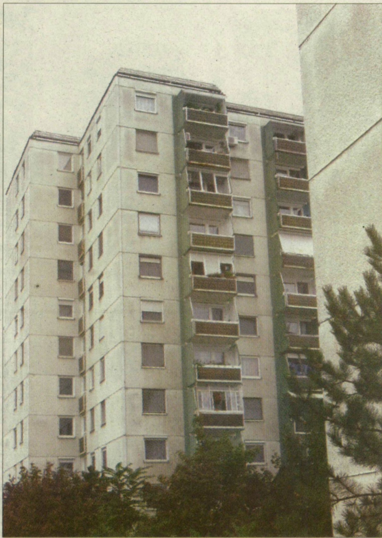
A panellakók nem válhatnak egyedi fűtésre – pedig szívesen megtennék

Sajnos, aki nem idős és nem beteg, az is fázik a panellakásban, hiszen ez a beton csak úgy ontja a hideget, sajnos nyáron meg a meleget. Valahogy alkalmazkodni kell